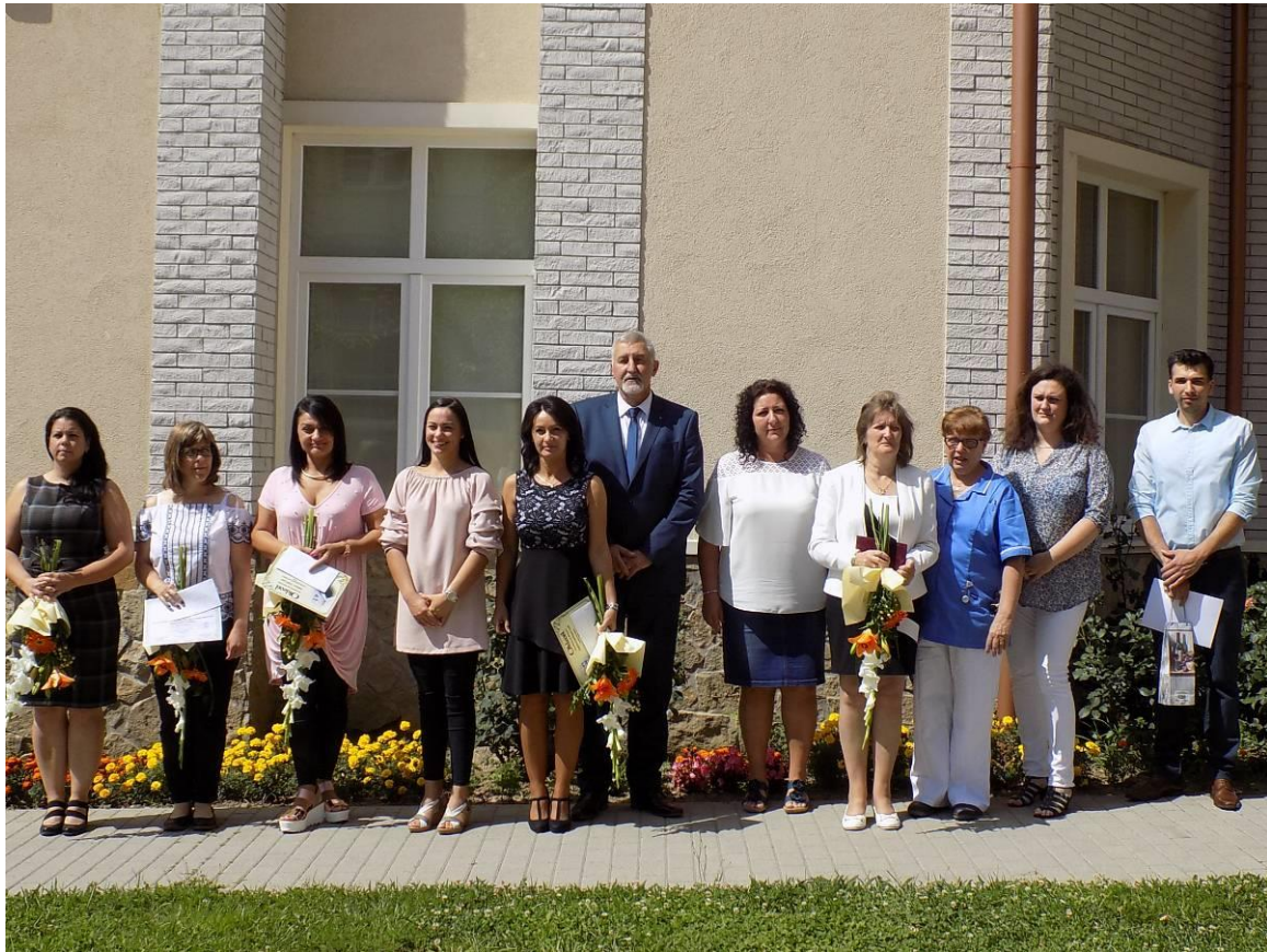
A jutalomban, dicséretben részesülő kórházi dolgozók, csoportvezetők

Az ünnepség Ottó Péter polgármester pohárköszöntőjével zárult. Először is Semmelweis Ignácra emlékezett meg, akinek az életútja nagyon sok tanulsággal szolgál a ma embere számára is. Kiemelte, hogy az emberiség nagy dolgait mindig megfigyeléseken alapulva tudta továbbvinni, felfedezései az emberi megfigyelőképességnek voltak köszönhetőek, amely tulajdonság nagyon fontos az egészségügy mindennapjaiban is. Gratulált a kitüntetésben, elismerésben, jutalomban részesülőeknek. Fontosnak nevezte, hogy az ünnepeltek számára mit ad az ünnep, hogyan érzik magukat, és azt is, hogy az egészségügyi dolgozók visszacsatolást kapjanak a páciensektől, betegektől, az ő nevükben is el lehessen mondani a köszönet szavait.